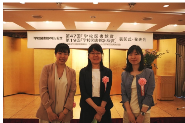
編集に携われた帝国書院の皆様