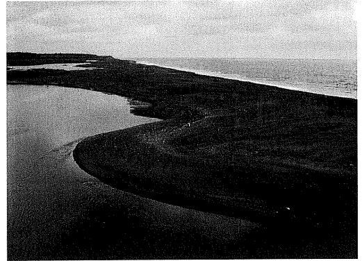
写真 4 津波の押し波によって形成されたウォッシュ オーバーファン (当縁川河口付近)