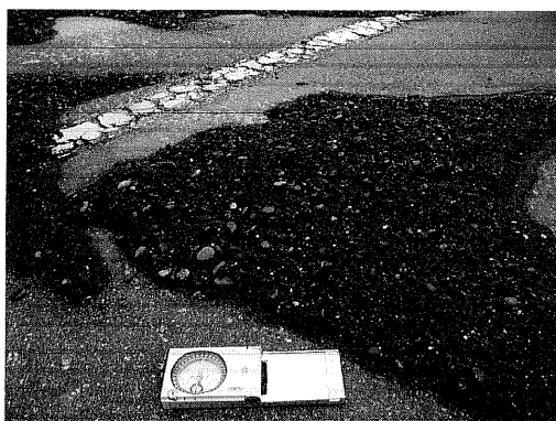
写真11 写真10のグラベルデューンの拡大写真（大津港）