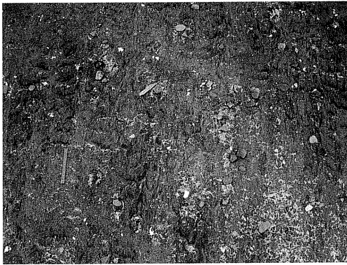
写真 2 津波の引き波時に生じたカレントリップル (浜大樹漁港)