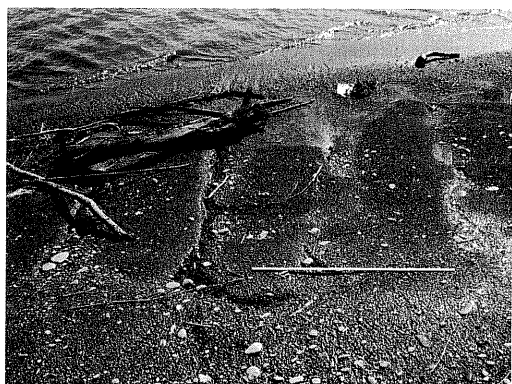
写真8 写真7のウェーブデューンの拡大写真（波長約80cm，波高約6cm）（生花苗沼南部）