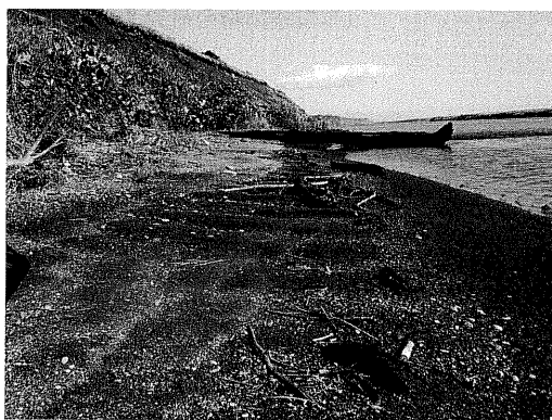
写真7 津波の押し波によって形成されたウェーブデューン（生花苗沼南部）