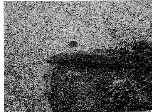
写真 6 津波によって形成された“津波堆積物” (大 津港)