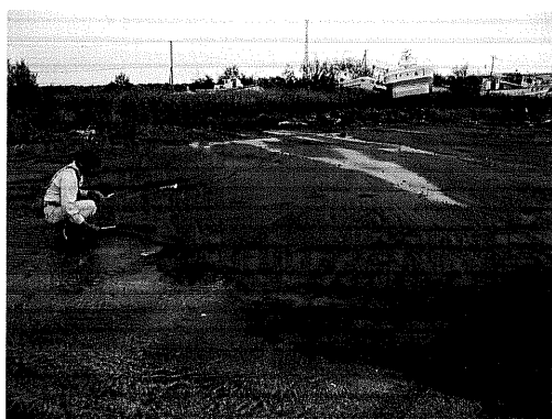
写真12 津波の引き波によって形成された舌状砂体とカレントリップル（大津港）