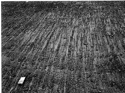
写真 3 津波の引き波時に生じたカレントクレッセン トマーク (十勝港)