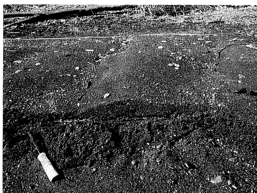
写真9 写真7のウェーブデューンの断面写真（生花苗沼南部）