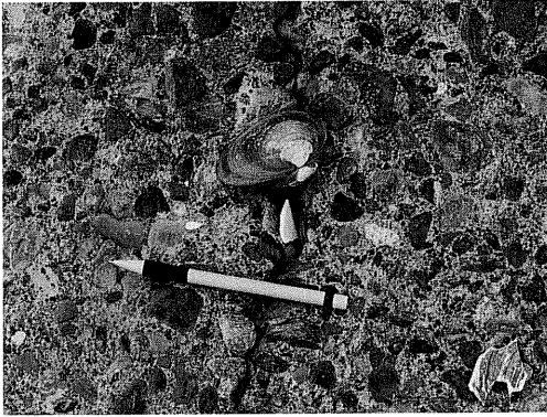
写真 1 津波によって港に打ち上げられたウバガイ (浜大樹漁港)