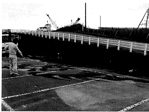
写真10 津波の引き波によって形成されたグラベルデューン（大津港）