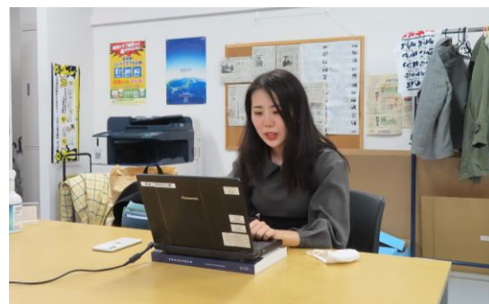
新家（D1）の受賞時の様子 （文責：渡邊勇）